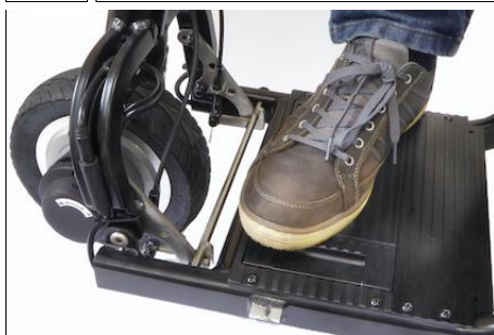
11 ...zo niet, druk dan met uw voet op de voetplaat om de scooter open te vergrendelen.