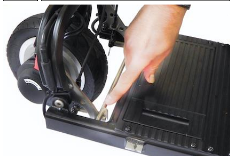
10 Zorg ervoor dat de vergrendelingen zijn vergrendeld aan de stalen staaf...