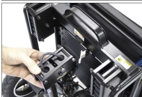
2 ...en laat de kolom vrij slingeren.