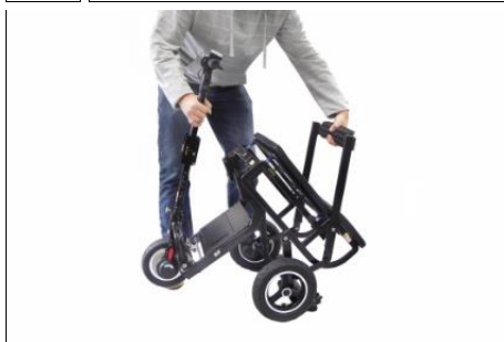
8 uit elkaar trekken en...