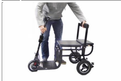
9 ...de scooter zal zichzelf vergrendelen in zijn open positie.