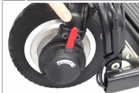
12 Controleer of de magnetische rem in de VERGRENDELDE stand staat om de motor in te schakelen.