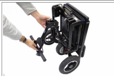
3 rek het stuur naar buiten en omhoog..