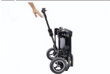
4 ... totdat ze in een verticale lijn vastklikken.