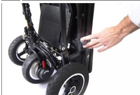
5 Zoek de kleine zwarte stopper aan de zijkant en trek om het voorwiel los te maken.