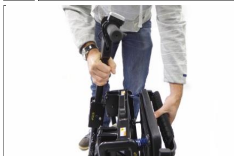
6 oud de stuurkolom en rugleuning vast en trek ze uit elkaar...