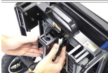
1 Stuurkolomvergrendeling losmaken...