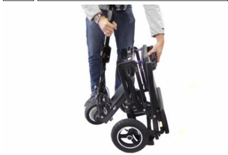
7 ...de scooter klapt uit als je de rugleuning en de stuurkolom uit elkaar trekt...